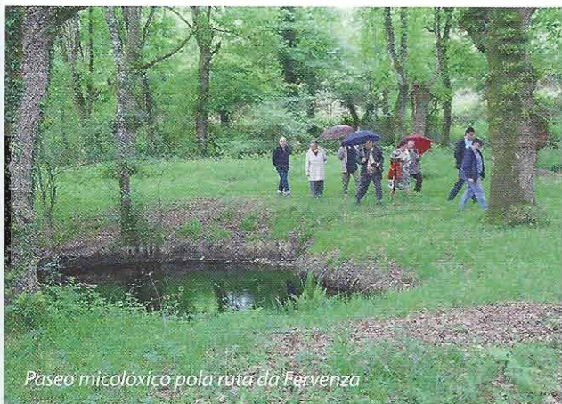
Paseo micolóxico pola ruta da Fervenza

4. Ante a necesidade de mellorar a comunicación e coñecemento mutuo das Asociacións e poder plantexar accións conxuntas como Federación é necesario dispoñer e organizar a información das asociacións, que nestes momentos resulta inaccesible, semella estar espallada ou non organizada e considérase imprescindible unificar os criterios para sistematizar esta información (censos e datos das asociacións, pautas para realizar actividades de investigación, presentación as Institucións de proxectos comúns, etc.) acórdase crear unha comisión xestora que se encargue de elaborar os documentos necesarios para poder recabar e unificar toda esta información. Comezase pola elaboración dunha ficha que permita ter un censo completo cos datos básicos das asociacións micológicas.