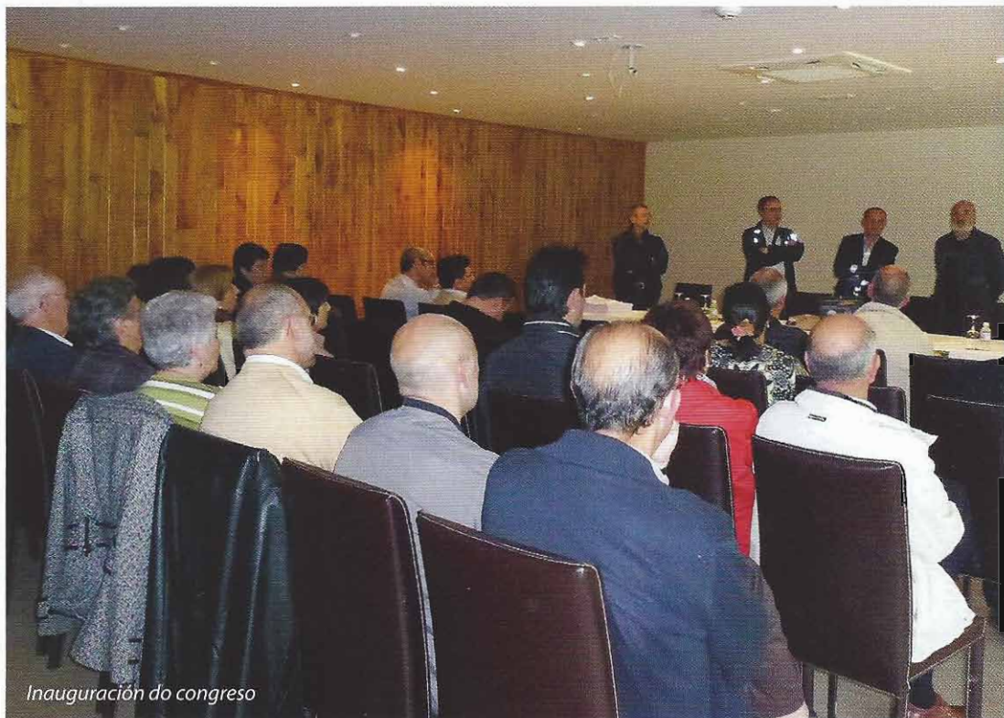
Inauguración do congreso